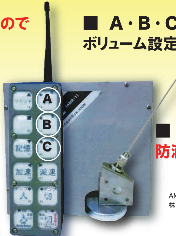
AMR-1 株式会社アマング